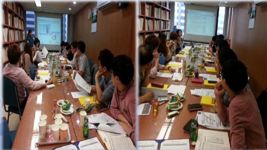
<역량강화분과회의-정보화 컨설팅 교육>