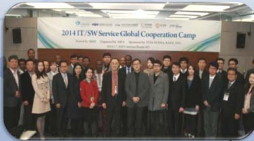
<제2차 해외공무원 교류워크숍>