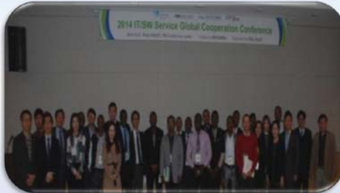
<제1차 해외공무원 교류워크숍>