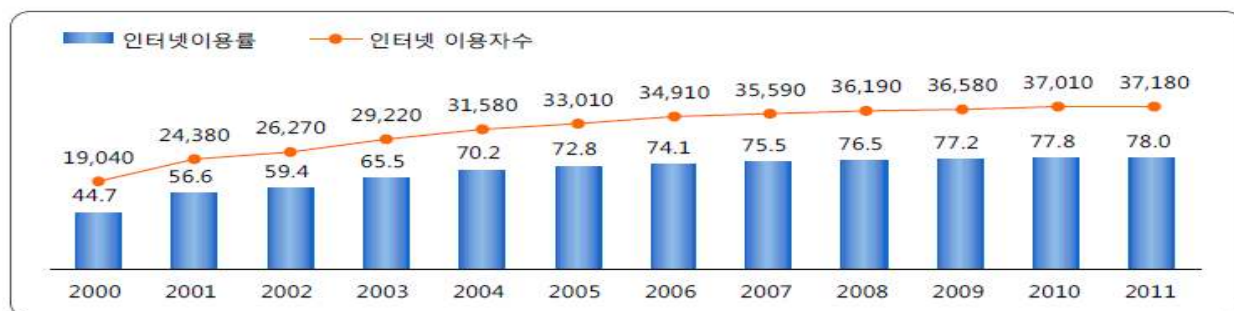
[그림 1. 인터넷이용률 및 이용자수 변화 추이(% 천명)]