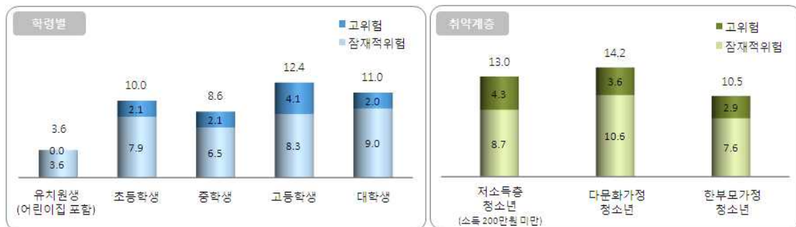
< 학령별·취약계층 인터넷중독률(%) >

□ 성인 중독률은 6.8%(1.0%p ↑)이며 대학생의 중독률(11.0%)이 가장 높고, 특히 성인 무직자의 6.0%가 고위험군으로 나타남